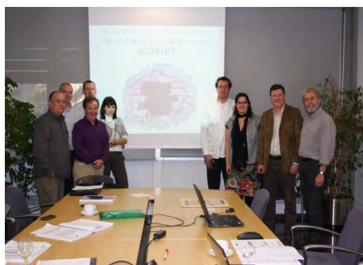
Socios del Proyecto SUPPORT procedentes de Reino Unido, Irlanda, Polonia, Alemania, España and Francia fotografiados durante la reunión de lanzamiento en la Universidad Politécnica de Valencia

Los socios de SUPPORT han acordado reunirse el próximo día 28 y 29 de Marzo de 2011.