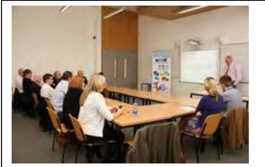
One of the LCEB and NMEA Pilot Test Groups meeting in Dundalk, ROI.

Die SUPPORT-Partner aus Irland und aus dem Vereinigten Königreich haben im August 2012 gemeinsam eine Reihe von „Testläufen“ mit den SUPPORT-Produkten durchgeführt.