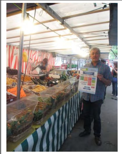
Die SUPORT "Markt-Initiative" besucht den Markt Mouton-Duvernet im 14. Pariser Arrondissement.

Mitten im emsigen Treiben der Märkte wurden handwerklich geprägte KMU angetroffen, die sich zur Entwicklung innovativer Produkte für die Zusammenarbeit mit Forschungseinrichtungen interessierten.